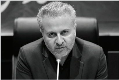
مدیرعامل شرکت گاز استان فارس